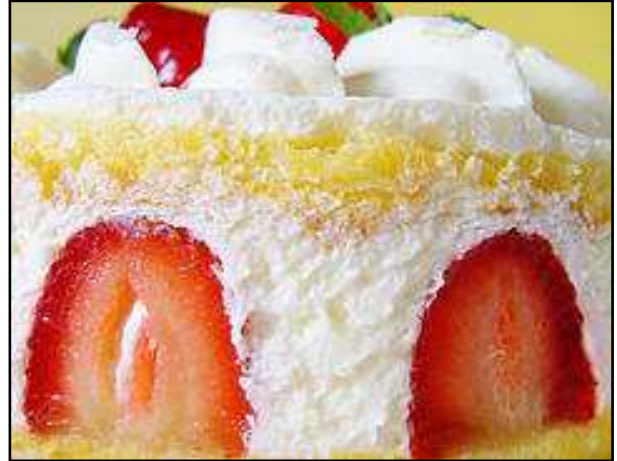
A kép csak illusztráció.