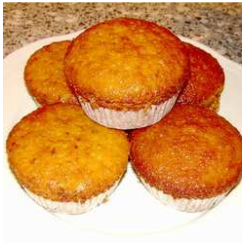
A kép csak illusztráció.