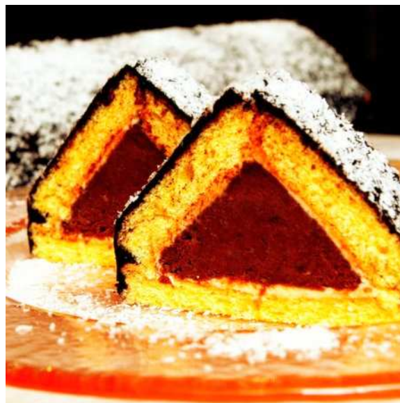
A kép csak illusztráció.